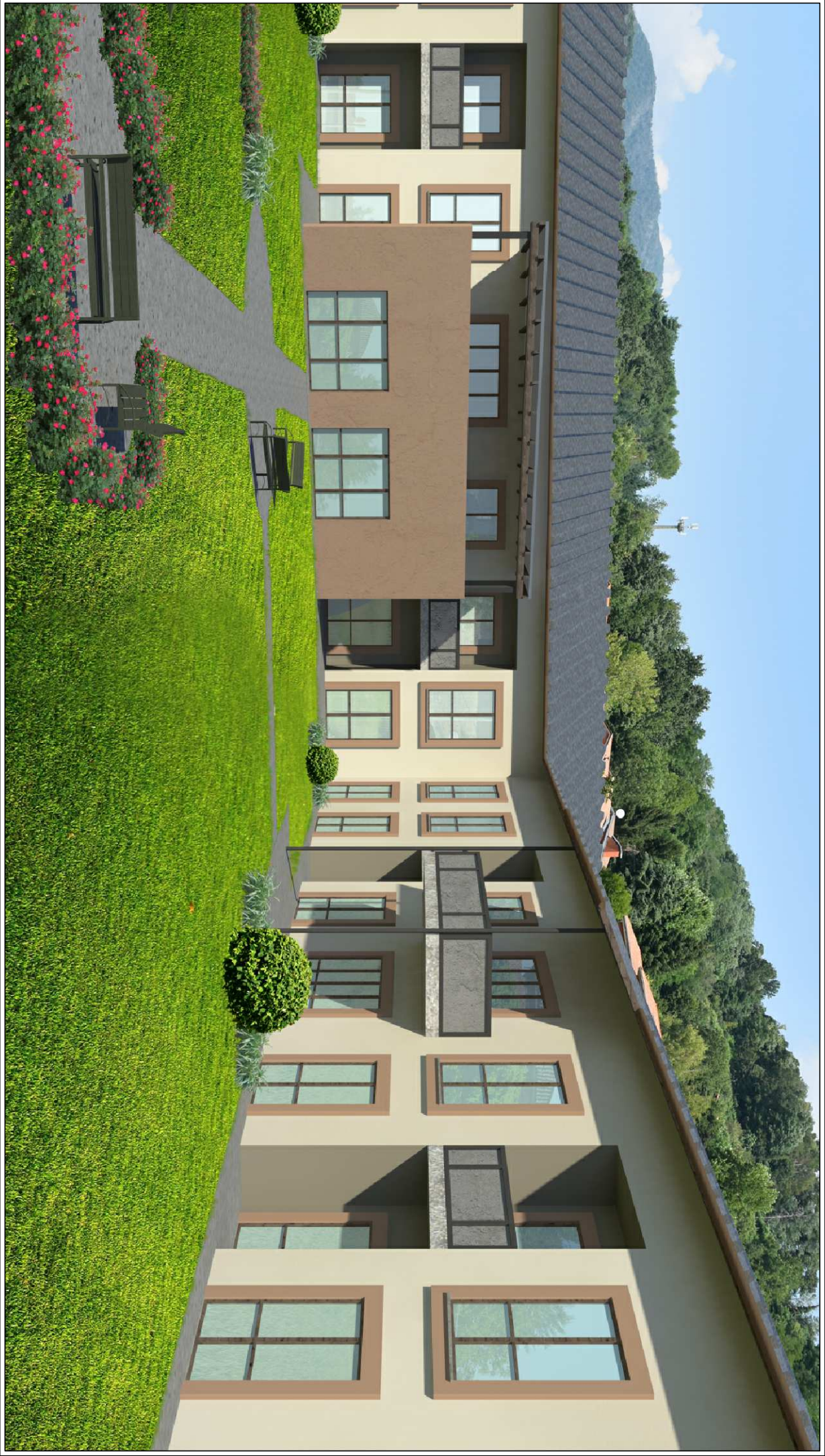
SIMULAZIONE FOTOREALISTICA - VISTA PROSPETTI PRINCIPALI 1