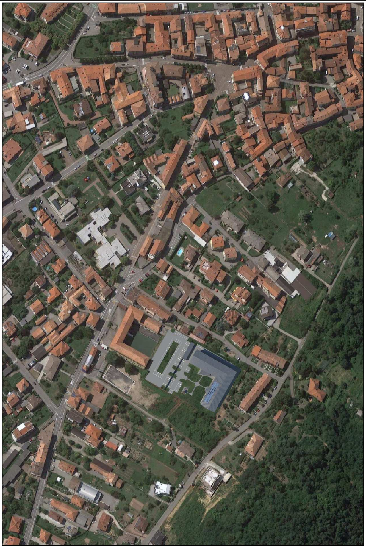
SIMULAZIONE FOTOREALISTICA - VISTA AEREA