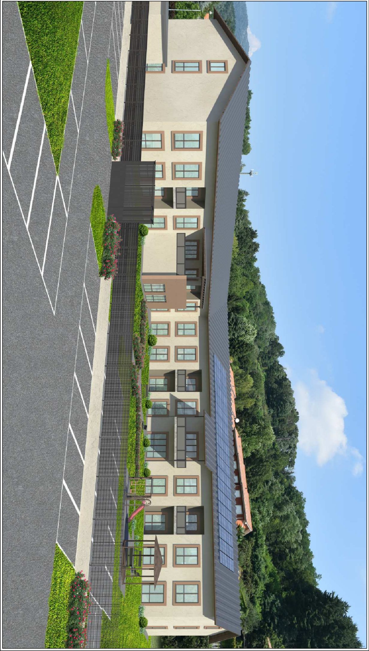
SIMULAZIONE FOTOREALISTICA - VISTA PROSPETTI PRINCIPALI 3