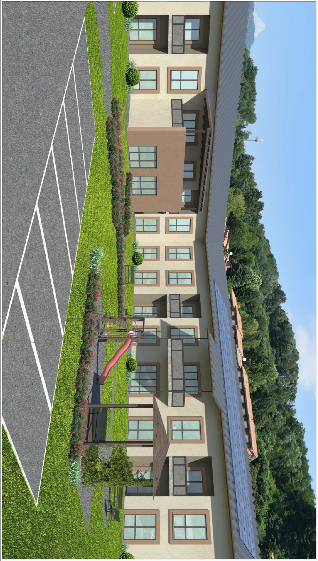
SIMULAZIONE FOTOREALISTICA - VISTA PROSPETTI PRINCIPALI 2